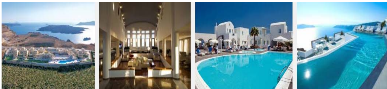
或 El Greco Resort: