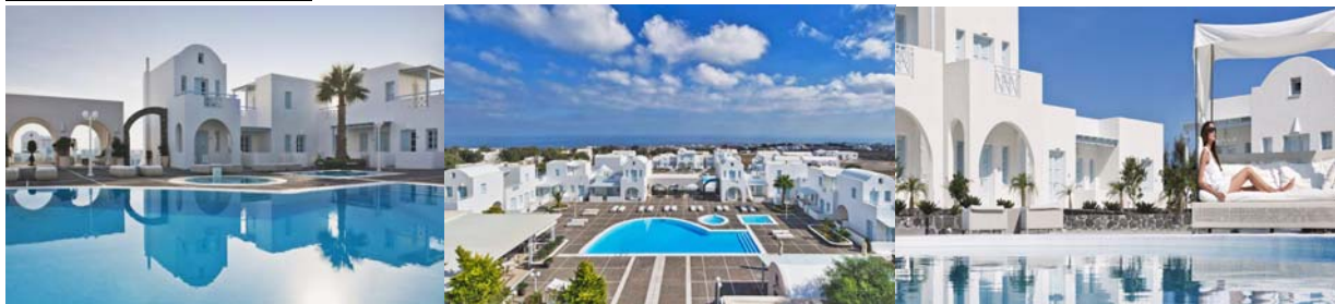
或 On the Rock Hotel 或同級 ※若遇滿則安排改住懸崖旅館。