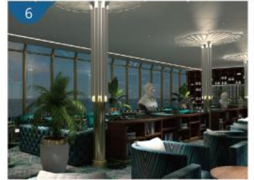
6 棕櫚閣 無論是品嚐精緻的下午茶，還是與知己把酒言歡，都有一望無際的海景相伴