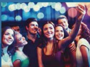
15 備有多款遊戲機的多用途活動專區