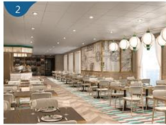
2 意大利比薩餐廳 融合意國及日式風味的新派意大利菜和比薩，專為熱愛創意美食的賓客而設