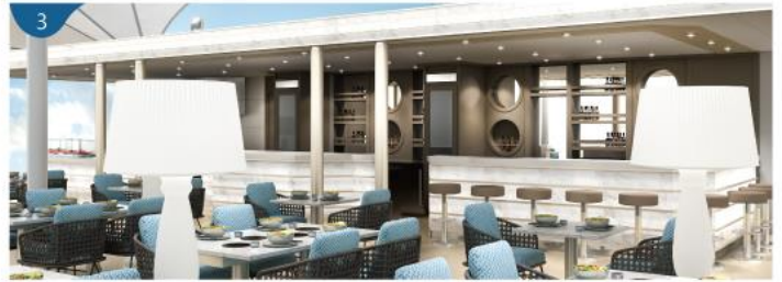
3 海鮮燒烤餐廳 (由名廚馬克·貝斯特主理) 在浪漫的星空下品嚐澳大利亞名廚以精選新鮮海產烹調的晚餐，享受優雅舒適的戶外用餐體驗及壯闊海景