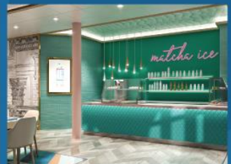
14 抹茶坊 暢享風靡日本以至整個亞洲的抹茶甜品