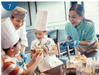
7 小小夢想家天地 專為小朋友而設的夢想天地，透過遊戲、工作坊、化妝派對及DJ攤位，打造美妙海上時光