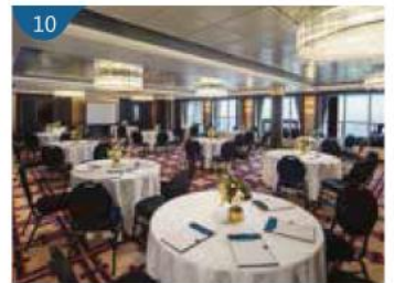
10 8號宴會廳 設備煥然一新的郵輪，適合團體舉辦各類會慶活動及會議