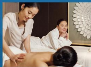
16 水療中心 水療護理、腳底按摩及桑拿浴