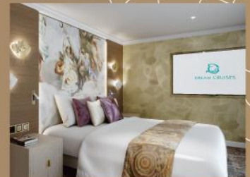
超過40間寬敞豪華套房