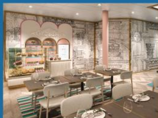
13 甜品匯 精緻美味蛋糕及手工朱古力