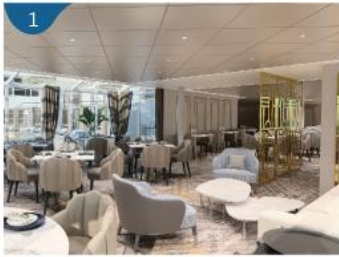
1 皇宮 尊享寬敞套房、歐式私人管家服務及專屬設施