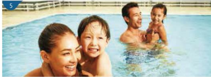
5 羅馬泳池 以古羅馬為設計主題的戶外泳池甲板，備有「凱撒」滑梯、按摩池、現場樂隊表演舞台及大型LED屏幕，可供暢泳及作日光浴