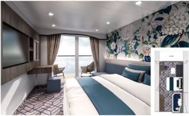
面積由18平方米起 | 可容納人數: 3-4人 | 位於9/10/11層