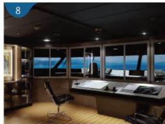
8 船長室觀景廊 寓教於娛的互動駕駛台，讓您體驗當船長的樂趣