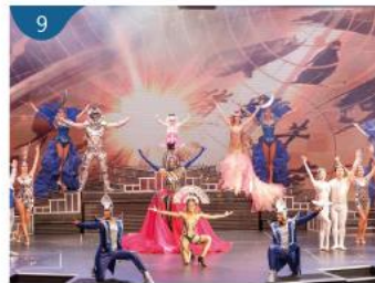
9 星座劇院 以孔雀為設計靈感的華麗劇院，呈獻百老匯式大型現場表演