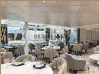
精緻豐盛的免費餐飲

「The Palace 皇宮」設有超過40間尊貴套房，包括2間皇宮庭苑別墅以及尊屬泳池、酒廊及餐廳，致力以獨特的「船中船」概念為旅客打造薈萃精品郵輪特色的尊屬天地，匯聚絕無僅有的奢適生活體驗。賓客可奢享精緻豪華的意式風格套房和皇宮餐廳的亞洲及歐洲美饌，隨時候命的星夢管家團隊，以體貼周到的服務及豐厚全面的專業知識為旅客帶來無與倫比的尊貴享受。