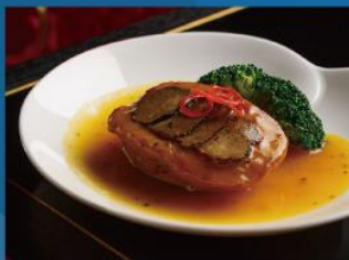
11 絲路花舞中餐廳 精心烹製的傳統點心及粵菜