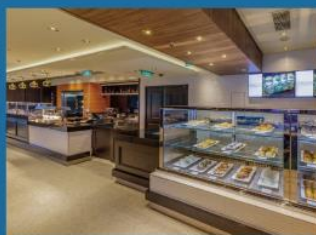
17 大堂咖啡 歐式咖啡座提供新鮮沖調的咖啡及名茶