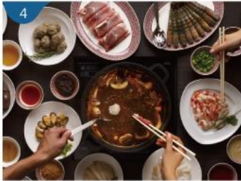
4 火鍋 正宗中式盛宴，備有選擇豐富的滋補湯底