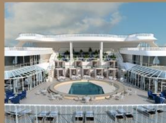
私密專屬的各項設施