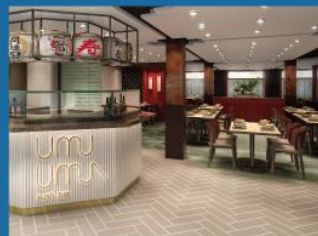
12 海馬日本料理 - 壽司及鐵板燒 新鮮壽司及經典日本菜式